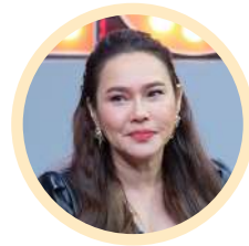
ใหม่ เจริญปุระ ศิลปินนักร้อง นักแสดง